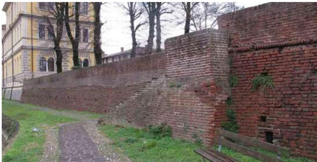
Vista dal camminamento lungo il Naviglio Pallavicino