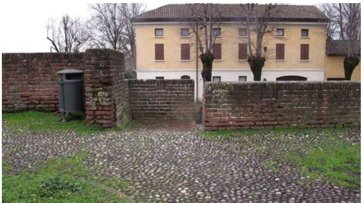
Vista del parapetto della scala da Piazza Enea Ferrari